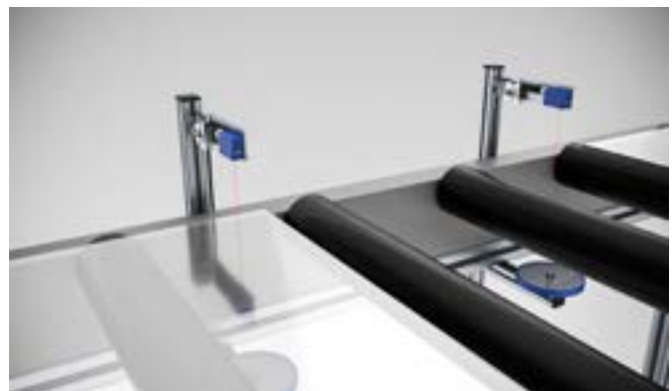
Detekce transparentních desek při transportu na válečkovém dopravníku. Extrémní průhlednost skla pro viditelné, resp. infračervené paprsky v tomto případě nepředstavuje problém, jelikož jím ultrafialové světlo senzoru OR270478 neprostupuje.