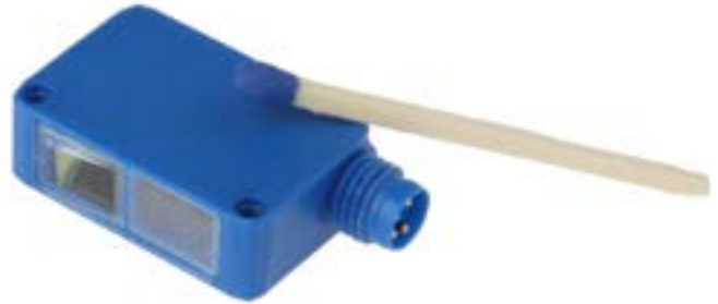
Novinka od ipf electronic umožňuje jednoduchou integraci i díky své kompaktní konstrukci – zde v porovnání se zápalkou

Pro tento snímač již tyto materiály zkrátka transparentní nejsou, jsou detekovatelné stejně jako zcela neprůhledné objekty. Výše popsaná otázka stupně transmise průhledných předmětů při viditelném záření a s ním spojených výzev pro konvenční optosenzoriku tudíž v případě OR270478 není nijak relevantní.