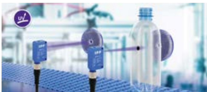
I při spolehlivé detekci PET lahví v rychle probíhajících procesech, známých z nápojového průmyslu, boduje OR270478 mimo jiné spínací frekvencí \leq 1\text{kHz} .

Oproti dosud dostupným optickým senzorovým systémům tedy toto řešení nevyžaduje žádnou vysokou citlivost pro detekci jednoznačného prahu spínání. Nachází-li se tudíž transparentní objekt mezi senzorem a reflektorem, pak je signál v porovnání s volnou světelnou závorou (žádný objekt v detekčním prostoru) dostatečně silný. Rozhodující výhodou pak je, že celkový systém navíc není nijak citlivý na znečištění. I sebetenčí transparentní fólie jsou systémem OR270478 detekovány velmi spolehlivě, přičemž možné problémy s měřením takovýchto materiálů, jak byly popsány v souvislosti s ultrazvukovými závorami, nemají jak vzniknout. Jelikož tento senzor disponuje vysokou spínací frekvencí v hodnotě \leq 1\text{kHz} , svou rychlostí překonává ultrazvukové senzory bezmála desetkrát.