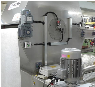
Filteranlage mit einem Drucksensor (Bildmitte) zur Füllstandskontrolle. Hat das Filtervlies seine Aufnahmekapazität erreicht, staut sich die zu filternde Flüssigkeit oberhalb des Vlieses. Der Drucksensor meldet dies an die Anlagensteuerung, sodass dass der verschmutzte Teil des Filters aus der Anlage befördert wird.