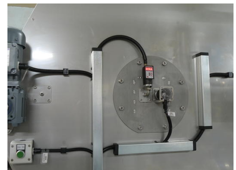
Detailaufnahme des Drucksensors zur Füllstandskontrolle oberhalb des Filterbypasses.

Der DW35311A und DW35311M sind zwei kompakte analoge Drucksensoren in Schutzklasse IP65 mit Sensorkopf aus Edelstahl und einem weiten Einsatztemperaturbereich von -20° C bis + 80° C. Während der DW35311A für Drücke von 0 bis 100mbar entwickelt wurde, eignet sich der DW35311M für einen Bereich von 0 bis 200mbar. „Wir verwenden für unsere Filteranlagen bereits von Anfang an auch diese Sensoren von ipf electronic, wobei wir je nach Anwendung und Behältertiefe entweder das Gerät mit dem kleineren oder größeren Druckbereich benötigen. Da beide Sensorversionen im Millibarbereich arbeiten, liefern sie uns auf jeden Fall die hohe Auflösung bzw. exakten Ausgangssignale, die wir für unsere Umhebestationen sowie Saubertanks mit vergleichsweise geringer Füllstandshöhe von z. B. ein oder zwei Metern benötigen. Die Messbereiche herkömmlicher analoger Drucksensoren, die sich bspw. zwischen 0 bis 1bar bewegen, wären hierfür viel zu ungenau“, erklärt Volker Koczkowski und gibt gleichzeitig zu bedenken: „Die Wahl einer Pumpenregelung ist natürlich immer auch eine Kostenfrage auf Kundenseite, da bei Verwendung von analogen Drucksensoren die Steuerung aufwändiger ist und darüber hinaus ein Frequenzumrichter benötigt wird.“