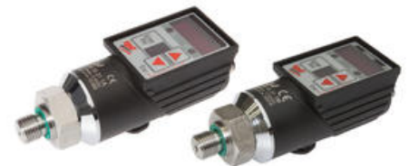
Die baugleichen Drucksensoren DW35311A (links) und DW35311M arbeiten im Millibarbereich und liefern daher die hohe Auflösung bzw. exakten Ausgangssignale, die für die Umhebestationen sowie Saubertanks mit vergleichsweise geringer Füllstandshöhe notwendig sind.

Hierzu Volker Koczkowski: „Mit dieser permanenten Regelung erreichen wir, dass die Pumpe in Abhängigkeit zum Flüssigkeitsstand in einem Behälter entweder schneller oder langsamer läuft und somit ihre Förderleistung stets anpasst. In der Regel reguliert sich die Förderleistung unserer Pumpen auf ein gewisses Niveau ein. Insbesondere bei einem hohen Fördervolumen können mit den analogen Drucksensoren die häufig auftretenden Ein- und Ausschaltzyklen, wie sie für digitale Drucksensoren typisch sind, vermieden werden, die letztendlich auch einen höheren Verschleiß der Pumpe bedeuten.“