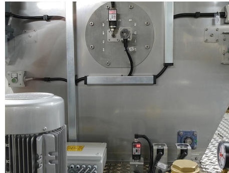
Der DW35311A (Bild, unten). Die analogen Signale dieses Gerätes lassen sich parallel zur kontinuierlichen Staudruckmessung und somit Füllstandsbestimmung in einem Becken dazu nutzen, die SPS der Filteranlage anzusprechen, um einen Pumpenantrieb (im Bild links) über einen Frequenzrichter permanent zu regeln.