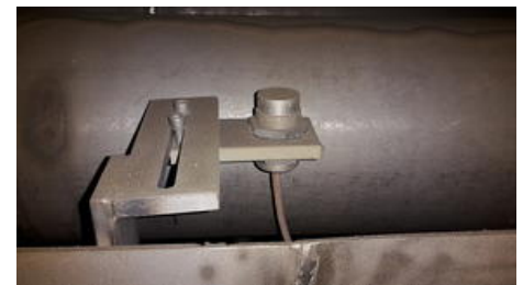
Indukční snímače mají aktivní povrch z nerezové oceli, a proto jsou velmi robustní (třída krytí IP68) a jsou určeny pro okolní teploty až do +70 °C.