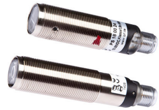
Jednosměrná bariéra sestávající z vysílače PS180024 (nahore) a přijímače PE180424 se ukázal jako správná volba pro náročnou aplikaci v mořicí lince.

Po povrchové úpravě jsou měděné plechy přepraveny do tří navazujících nárazníkových zón, které jsou rovněž monitorovány laserovými světelnými závorami. PS180024/ PE180424 jsou rovněž vybaveny laserovými světelnými závorami. Senzory hlásí do PLC (programovatelného logického automatu) kontinuální mořicí linky, kdy jsou vyrovnávací zóny plně přiřazeny, aby řídicí jednotka (jednotka) mohla systém zastavit a zabránit tak zaseknutí materiálu.