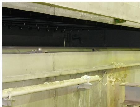
Na vstupu a výstupu mořící komory jsou umístěny tři paralelně ovládané indukční snímače. Speciální uspořádání zajišťuje, že ze spodní strany může být dotazována větší plocha měděné desky, a tak reaguje alespoň jeden senzor.