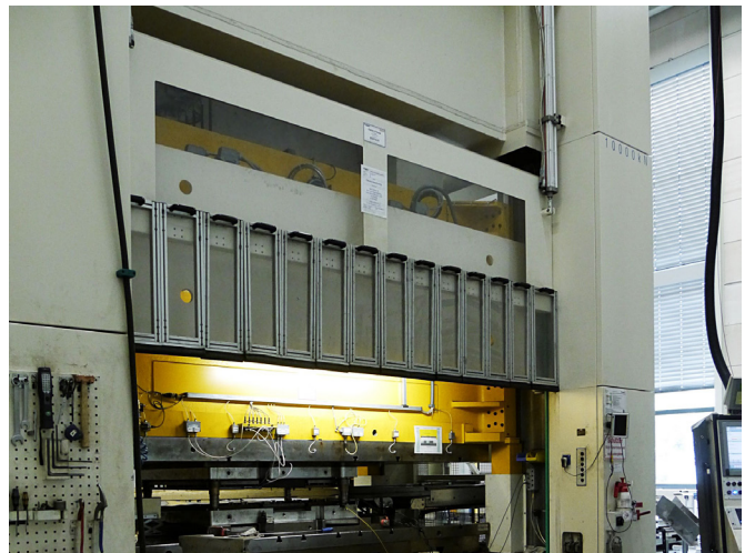
Presse zur Herstellung von Zylinderkopfdichtungen. Die Produktion erfolgt vom laufenden Stahlcoil, wobei die einzelnen Lagen der Mehrlagenstahldichtungen (MLS-Dichtungen) in Folgeverbundwerkzeugen gefertigt werden, die mehrere Arbeitsschritte vereinen.

„Überzeugt hat uns der Taster mit Blick auf unsere konkrete Anwendung als wirtschaftliche und damit echte Alternative zu kostspieligen Gabellichtschranken gleich in mehrerer Hinsicht: durch seine äußerst kompakte Bauform, seine Hintergrundausbldung, seine dynamisch einstellbare Tastweite und die hohe Schaltfrequenz bzw. niedrige Ansprechzeit. Zusammengekommen bieten diese Eigenschaften viel Potenzial für flexible Einsatzmöglichkeiten.“