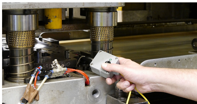
Über eine Teachbox lässt sich der Sensor sehr einfach von außen teachen, ohne das Gerät selbst berühren zu müssen.

„Zur Vorschubkontrolle wird beim ersten Schnitt an einer definierten Stelle im Stahlband ein Loch eingebracht, dass vom sogenannten Vorschubsensor erkannt werden muss, um die korrekte Position des Materials im Werkzeug für jeden einzelnen Hub sicherzustellen. Der Weitertransport des Bandes erfolgt dabei so schnell, dass für die sichere Erfassung des sogenannten Positionslochs lediglich Millisekunden zur Verfügung stehen. Innerhalb dieser sehr kurzen Zeit muss eine sichere Erfassung des Lochs gewährleistet sein und ein Schaltsignal für die SPS der Stanzpresse zur Verfügung gestellt werden. Geschieht dies nicht, wird die Stanzpresse über die SPS sofort gestoppt.“