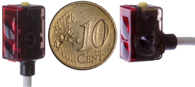
Kleine Tausendsassa und oftmals wirtschaftliche Alternative zu anderen Sensorlösungen: optische Sensoren der OTQ9-Serie mit Hintergrundaussendung. Hier im Größenvergleich mit einer 10-Cent-Münze.

In der Fertigung von Federal-Mogul Sealing Systems in Herdorf hat sich innerhalb weniger Jahre der wohl kleinste optische Sensor seiner Art zu einem wahren Dauerbrenner entwickelt. Und das aus mehreren triftigen Gründen.