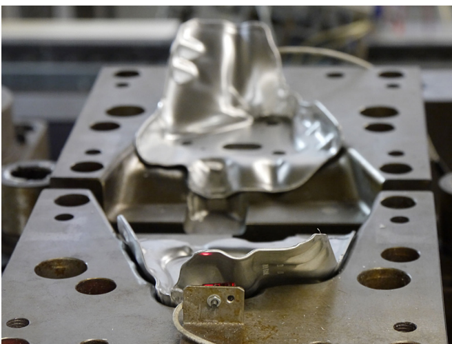
Hohe Prozesssicherheit: In verschiedenen Stationen des Folgeverbundwerkzeuges integrierte optische Sensoren stellen sicher, dass die jeweiligen Platinen zur Bearbeitung vorhanden sind.

Der Bedarf von Federal-Mogul Sealing Systems an den Geräten ist groß, denn sie befinden sich im permanenten Einsatz - und das nicht allein in der MLS-Stanzerei: „Wir haben die Vielseitigkeit des OTQ90170 schätzen gelernt.“ So werden die Geräte nicht nur zur Vorschubkontrolle in der Produktion von Zylinderkopfdichtungen verwendet, sondern auch bei der Fertigung von Hitzeschilden auf Transferpressen. „Die Pressen verfügen über verschiedene Bearbeitungsstationen und integrierte Handlingsysteme, die die Hitzeschilde je nach Bearbeitungsschritt in verschiedenste Positionen verfahren. Die Schilde werden dabei teilweise um 90 oder 180 Grad gedreht. Die optischen Sensoren von ipf electronic übernehmen in diesen Fällen die Positionsabfrage bzw. Lageerkennung der Hitzeschilde, um deren korrekte Position für den nächsten Stanzvorgang und damit eine prozesssichere Fertigung zu gewährleisten.“