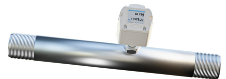
Einfach und präzise: Bei den Strömungssensoren von IPF sind die Minimal- und Maximalwerte des Analogausgangs bspw. für Druckluft bereits in Kubikmeter vorgegeben und können angepasst werden.

Alle Geräte mit integrierter Messstrecke und Messwertaufnehmer aus Edelstahl verfügen über einen Schaltausgang sowie einen Analogausgang (4...20mA) und lassen sich einfach über zwei Tasten am frontseitigen LED-Display parametrieren. Der SY92E296 ist druckfest bis 40bar, der SY92E297 und SL910020 halten Druckspitzen bis 16bar stand.