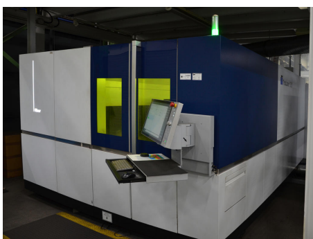
Im Zuge der Investition in neue Laserschneidanlagen wie z. B. einer TruLaser 5030 fiber von Trumpf nimmt Kettenwulf deren Verbrauch genauer unter die Lupe.

Als im Jahr 2022 bei Kettenwulf der Kauf einer neuen Generation an Laserschneidanlagen von Trumpf anstand, sollte der Verbrauch dieser Maschine ebenfalls unter die Lupe genommen werden, diesmal jedoch nur mit einem SL950020 von IPF. Der Leiter Energiemanagement präzisiert: „Insbesondere zum Verbrauch an technischen Gasen hatten wir bereits Erfahrungswerte von den beiden zuvor beschriebenen Maschinen. Daher konzentrierten wir uns bei dieser Anlage auf die Messung des Druckluftverbrauchs, zumal diese Lasermaschine auch mit Druckluft schneidet und die Daten hierzu von besonderem Interesse für uns sind.“