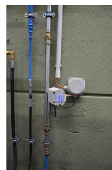
An der dritten Laserschneidmaschine musste mit einem SL950020 lediglich der Druckluftverbrauch ermittelt werden, da bereits Erfahrungswerte von zwei anderen Anlagen, insbesondere zu den technischen Gasen, vorhanden waren.