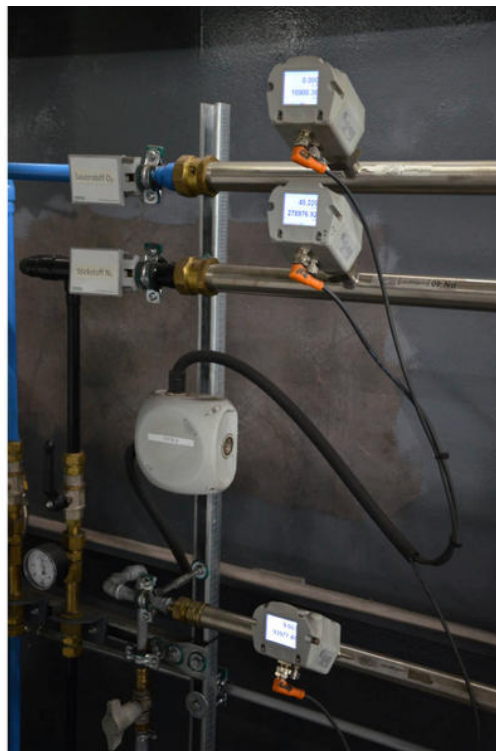
Verbrauchsmessungen an einer Laserschneidanlage bei Kettenwulf: der SY92E297 (oben) zur Messung von Sauerstoff, der SY92E296 (Mitte) (Referenzmedium Stickstoff) und der SL910020 (unten) für die Druckluft.