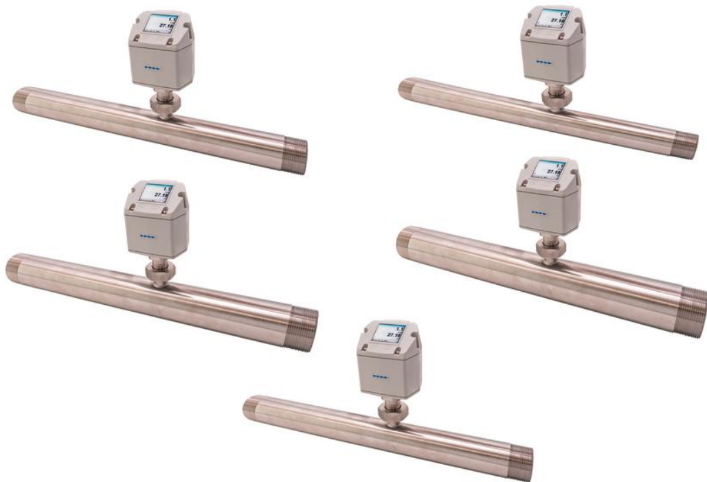
Unterschiedliche Einsatzbereiche, verschiedene Rohrquerschnitte aber einheitliches Design und Bedienkonzept: Der SY92E296 und SY94E304 für Stickstoff (links von oben), der SY92E297 für Sauerstoff (Mitte, unten) und der SL910020 sowie SL950020 (rechts, von oben) zur Messung des Druckluftverbrauchs.