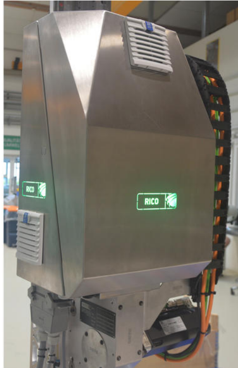
Une idée inhabituelle : RICO Elastomere Projecting indique l'état de ses manipulations de démoulage par le changement de couleur du logo de l'entreprise.