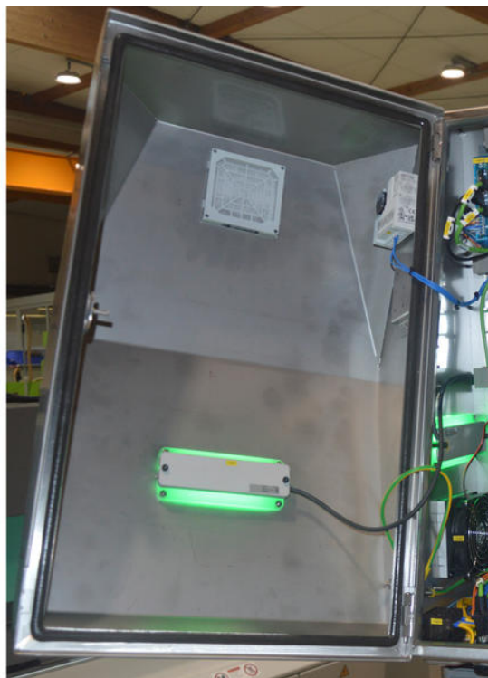
Très peu d'espace de montage : la lampe de signalisation à LED multicolore est installée dans la porte et latéralement dans une paroi du boîtier (à droite) du handling, ici dans un rotor eCO.