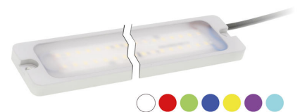
Niezwykle płaskie diody sygnalizacyjne RGB EZ38 firmy IPF, które mogą wizualnie wyświetlać łącznie siedem stanów systemu.