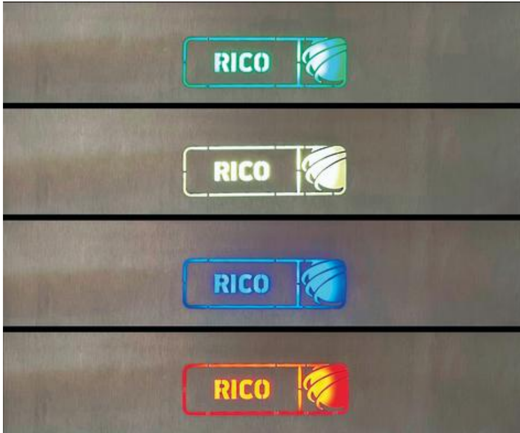
Za pomocą logo wyświetlane są cztery stany obsługi: Tryb automatyczny (zielony), tryb konfiguracji (żółty), połączenie z siecią (niebieski) i usterka (czerwony).