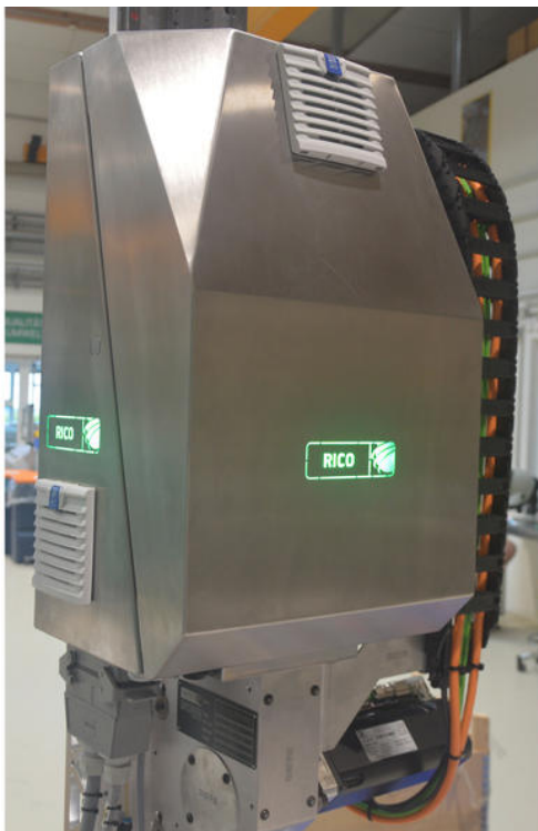
Niezwykły pomysł: RICO Elastomere Projecting wskazuje status obsługi rozformowywania poprzez zmianę koloru logo firmy.