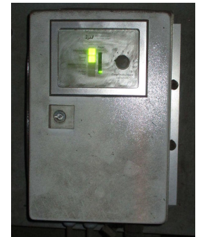
L'unité d'évaluation permet de régler le comportement de réponse de la bobine de détection.

Georg Fischer Automobilguß à Singen a finalement trouvé en ipf electronic une équipe d'ingénieurs et de techniciens motivés pour s'atteler à cette tâche ambitieuse. Dès le début, les spécialistes d'ipf electronic ont envisagé comme solution la plus judicieuse un système composé d'une bobine de détection de métaux inductive et d'un appareil d'analyse. Le système de détection de métaux d'ipf electronic est conçu pour la détection de très petites pièces. Associé à un réglage de la sensibilité, ce système réagit de manière fiable aux petites pièces comme les clous ou les écrous par exemple, avec une sensibilité maximale. La bobine de détection est montée avec des colonnes en PVC sur une plaque de base en aluminium qui protège contre les interférences électromagnétiques de la structure de base. Ce concept garantit en outre un montage très stable, comme cela est nécessaire dans l'application chez Georg Fischer Automobilguß. La bobine du détecteur est reliée à l'unité d'évaluation par un câble spécial qui peut être rallongé jusqu'à 50 mètres en cas de besoin.