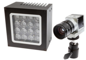
Les caméras haute vitesse peuvent communiquer avec les systèmes de contrôle courants afin d'automatiser un enregistrement via Ethernet ou des E/S numériques.

Afin de garantir un maintien sûr des croisillons dans les logements, une pince de maintien se trouve à l'un des deux points de réception des pivots d'articulation. Certaines de ces pinces ont cependant été endommagées de temps en temps pendant l'usinage. Il n'a toutefois pas été possible d'en déterminer la cause en raison de la vitesse de traitement élevée de l'unité de retournement.