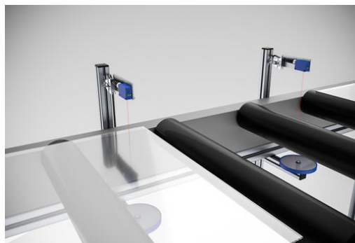
Detektion von transparenten Scheiben, die über eine Rollenbahn transportiert werden. Die extrem hohe Durchlässigkeit für sichtbare bzw. Infrarotstrahlung bei Glas macht hier keine Probleme, da das Material für die UV-Strahlung des OR270478 keine Durchlässigkeit aufweist.

Die Detektion transparenter Folien ist mitunter schwierig. Bei Ultraschallschranken kann es vorkommen, dass bei nicht ausreichender Spannung des Materials zwischen Sender und Empfänger der Schallimpuls des Senders über die Luftmoleküle auch die zu erfassende Folie in Schwingung versetzt, wodurch der Signalverlauf zwischen Sender und Empfänger nicht unterbrochen wird. Beim Sensor OR270478 tritt diese Problematik erst gar nicht auf.