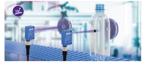
Auch bei der zuverlässigen Erfassung von PET-Flaschen in schnell laufenden Prozessen, wie sie aus der Getränkeindustrie bekannt sind, kann der OR270478 u.a. mit einer Schaltfrequenz von \leq 1\text{kHz} punkten.

Im Gegensatz zu den bislang erhältlichen optischen Sensorsystemen benötigt die Lösung daher keine hohe Empfindlichkeit zur Ermittlung einer eindeutigen Schaltschwelle. Befindet sich demnach ein transparentes Objekt zwischen Sensor und Reflektor, ist der Signalhub im Vergleich zur freien Lichtschranke (kein Objekt im Erfassungsbereich) entsprechend hoch, woraus u.a. der entscheidende Vorteil entsteht, dass das Gesamtsystem auch sehr unempfindlich auf Verschmutzungen reagiert. Selbst extrem dünne, transparente Folien erkennt der OR270478 äußerst zuverlässig, wobei sich die im Zusammenhang mit Ultraschallschranken schon dargestellte Problematik bei der Detektion solcher Materialien erst gar nicht ergibt. Da der Sensor zudem mit einer sehr hohen Schaltfrequenz von \leq 1\text{kHz} aufwarten kann, übertrifft er Ultraschallsensoren in punkto Schnelligkeit um nahezu den Faktor 10.