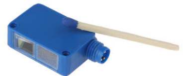
Il nuovo prodotto di ipf electronic promette anche una facile integrazione grazie al suo design compatto - qui a confronto con un fiammifero.

Per il sensore, tali oggetti non hanno più la proprietà della trasparenza, ma vengono rilevati come oggetti completamente opachi. La trasmittanza degli oggetti trasparenti per la radiazione visibile descritta in precedenza e le relative sfide per i sensori ottici convenzionali non sono quindi rilevanti per il dispositivo.