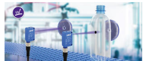
The OR270478 może również zdobywać punkty z częstotliwością przełączania \leq 1 kHz.