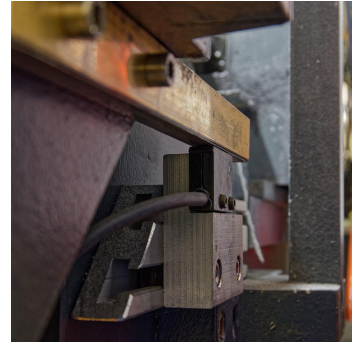
Der Sensor MW110430 ist an der Maschine montiert, damit das Anschlusskabel keinem Verschleiß unterliegt. Oberhalb des Sensors befindet sich das am Vortrieb befestigte und durch ein zusätzliches Edelstahlband vor Verschmutzung geschützte Magnetband.

Der als Fronttafelgerät ausgeführte Impulswächter wird über das integrierte Touchpanel parametrierbar, wobei derzeit insgesamt vier Maße hinterlegt sind. Der Impulswächter ist so voreingestellt, dass die Anzeige die jeweils aktuellen Maße grün visualisiert, während die Maschine in Betrieb ist. Nach Erreichen des Sollwertes schaltet die Maschine ab und die Anzeige wechselt auf Rot. „Der für die Maschine verantwortliche Mitarbeiter sieht somit sofort, wann die Bearbeitung eines Steines abgeschlossen ist.“