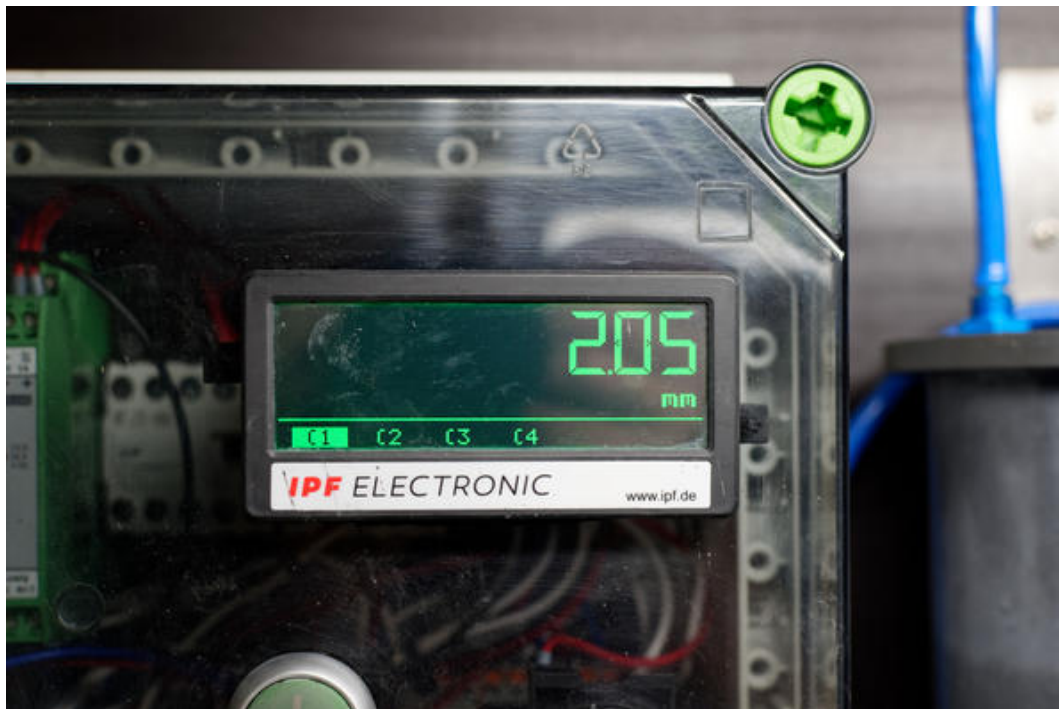
Im Impulswächter sind derzeit vier per Tastendruck wählbare Einpressmaße (C1 bis C4) für die Negativmatrizen hinterlegt. Das Fronttafelgerät visualisiert das jeweils aktuelle Maß für den Vortrieb mit grünen Ziffern. Die Anzeige wechselt auf Rot, wenn der Sollwert für die Tiefe der Matrize erreicht ist.