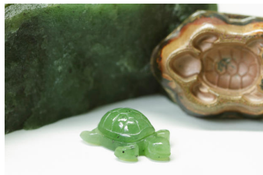
.. eine Schildkröte aus Jade. (Bild: Herbert Stephan KG)