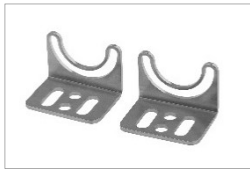
AE000011 (Montagewinkel V2A)

Die LED-Leuchte wird vollständig montiert ausgeliefert. Befestigen Sie die Leuchte mithilfe des separat zu bestellenden Befestigungszubehörs: