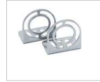
AE000017 (Befestigungswinkel V2A)

Über die Montagewinkel befestigt, ist die LED-Leuchte in der Rotationsachse stufenlos um 111° verstellbar. Verwenden Sie zur Befestigung der Montagewinkel die der Leuchte beiliegenden selbstschneidenden Schrauben!