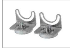
AE000012 (Montagewinkel V2A Inkl. Magnet)