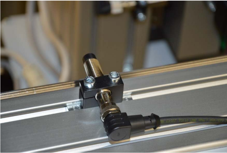
Bildunterschrift ipf_app_MD_Automation_03.jpg: Für eine einfache Montage der Sensoren an den Profilen sorgt die als Zubehör erhältliche Befestigungsschelle AY000032 aus Aluminium.