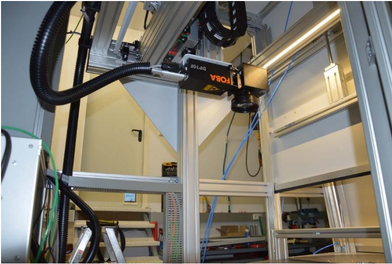
Bildunterschrift ipf_app_MD_Automation_05.jpg: Aufgrund einer speziellen Optik können Beschriftungsfelder bis 200 x 200 mm abgedeckt werden, ohne den Laser verfahren zu müssen.