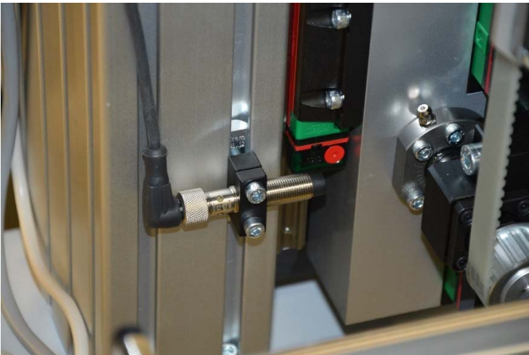
Bildunterschrift ipf_app_MD_Automation_04.jpg: Ein Merkmal des IM120120 ist die vergossene Elektronik in einem stabilen Metallgehäuse (Schutzart IP67), um sie vor Erschütterungen zu schützen.